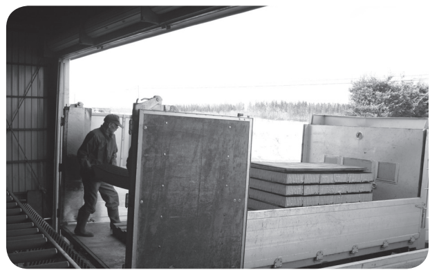
出来上がったビートポットはトラックに積み込まれます

町内てん菜育苗センターが3月7日の御影と美蔓を皮切りに8日に下佐幌、11日にメロディーファームが操業を始め、美蔓が17日、下佐幌が18日、御影とメロディーファームが21日で無事操業を終了しました。御影てん菜育苗センターでは播種ライン一式が更新され、順調に稼動していました。それぞれの施設の作成数は下佐幌が9, 364冊、メロディーファームが9, 971冊、美蔓が10, 034冊、御影が14, 886冊でした。 町内では現在152戸の組合員の皆さんがてん菜を耕作しており、その内移植栽培の約80%が育苗センターのポット苗を利用しています。 現在の育苗状況は「パピリカ、ラテール共に発芽率は良好で苗は順調に育っています」（ホクレン原料所）と話していました。