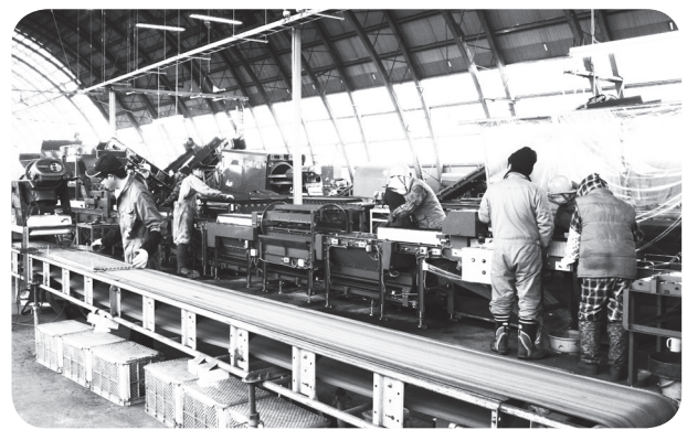
御影てん菜育苗センター