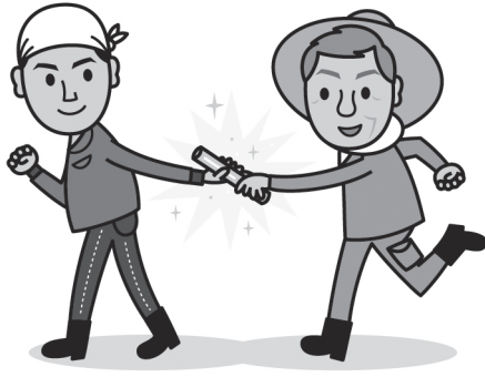
イラスト：ゆきたけし

監修:全国農業協同組合連合会 耕種総合対策部 TAC推進課 https://www.zennoh.or.jp/tac/