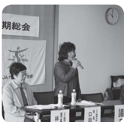
口田会長による挨拶